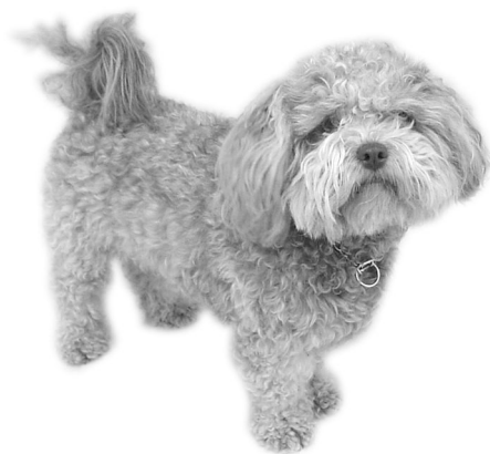
Noisette, la fidèle assistante

** Même la publicité s'y met: La collection Folio (Gallimard) a récemment lancé au Québec une campagne prônant «l'abstinence télévisuelle» en proposant une «trousse de décrochage télévisuel» avec tout achat de deux titres. Les slogans ne manquent pas de punch: «Un Folio lu, une émission stupide pas vue» ou encore «Une télé fermée, un enfant sauvé!»